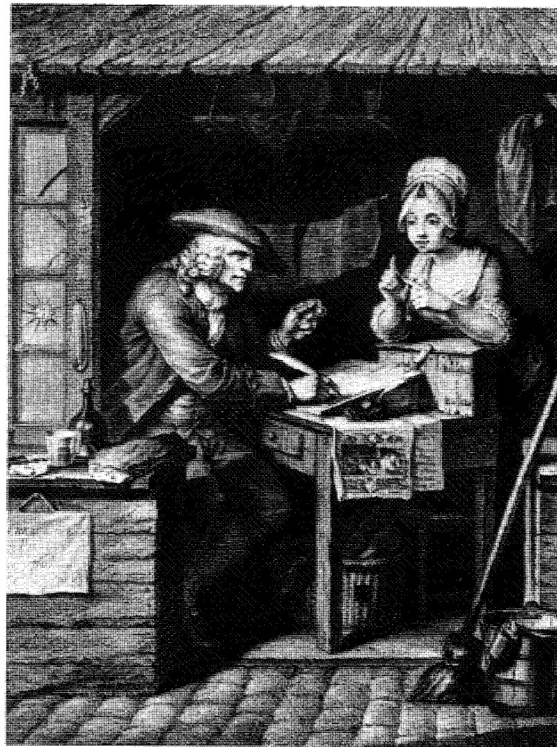
Abb. 5 Beim Schreiber: die Aufzählung der Beschwerden (Stich nach P. A. Wille)

In jedem Dossier kann man eine einmalige Geschichte entdecken, die Geschichte eines Konflikts, in dem die einen darum kämpfen, ihren Partner so lange wie möglich im Gefängnis oder im Kloster festzuhalten, während die anderen für ihre Freilassung streiten. Jeder Konflikt hat seine Eigendynamik, jeder ist einzigartig und hat eine besondere dramatische Intensität. Daher ist es unmöglich, vorschnell zu verallgemeinern; man muß sich der Lektüre dieser vielen Seiten überlassen, wo eine Menge Personen auftritt und wieder verschwindet, die alle bemüht sind, Licht in die Ereignisse zu bringen und so nahe wie möglich an gerechte Lösungen heranzukommen. Man kann alles und das genaue Gegenteil davon in diesen verworrenen Fällen lesen, die von zugleich