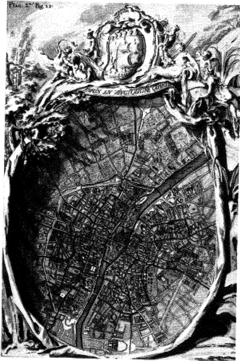
Abb. 1 Präsenz der Polizei: die Bezirke von Paris

Lettres de cachet; wenn es um einen besonderen Konflikt zwischen Meister und Lehrling geht, ziehen die ordentlichen Richter den Fall an sich. In ihrem Interesse liegt es, schnell zu entscheiden, die Angst vor Unruhe in den Werkstätten ist stärker als der Wunsch nach einem ordnungsgemäßen Verfahren. Die Lettre de cachet ist immer noch die entschieden einfachste Möglichkeit, diskret und heimlich einen Aufsässigen einzusperrn, der an jedem Zahltag mehr vom Meister fordert oder keine Hemmungen hat, sich aufzulehnen. Diese offenkundige Verwendung der königlichen Order erklärt zum Teil, warum in den Gerichtsarchiven so wenig Arbeitskonflikte greifbar werden, und gibt einem e contrario das Gefühl, daß (was allerdings zu beweisen wäre) eine Fülle von Konflikten unter dem hermetischen Bleidach der Lettres de cachet schnell verschleiert wurde. Eine Polizeisache daraus zu machen, ist eben bequem.