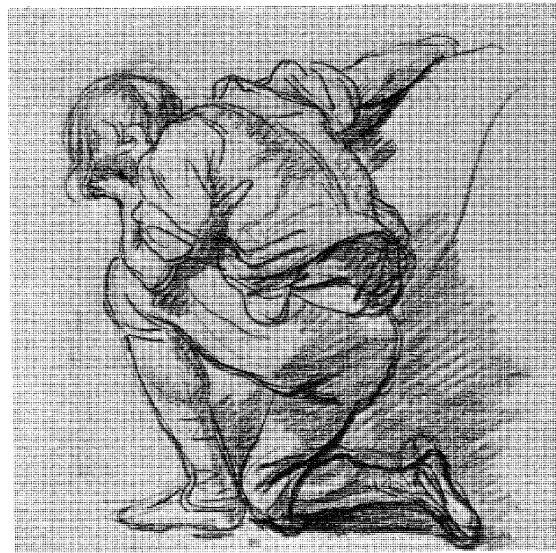
Abb. 6 Die Reue (Studie von Greuze zu Der bestrafte Sohn )

Zeit der Festsetzung miteinander umgehen. Der eine oder der andere Partner mag sich weit weg in Sainte-Pélagie, in der Salpêtrière oder in Bicêtre befinden, er ist immer noch präsent und versucht alles, damit man sich seiner erinnert. Die eingesperrten Frauen schreiben rührende Briefe an ihre Ehemänner; die einen feilschen ständig um die Kosten für den Unterhalt, die ihnen zu hoch scheinen, und führen alle möglichen Argumente an, um zu beweisen, daß die Summe, die sie bezahlen, für einen so niederträchtigen Menschen mehr als genug ist; die anderen verlangen sehr bald die Freilassung des Ehegatten und versichern der Obrigkeit, daß der Eingesperrte bereit. Wieder andere scheinen unglücklich über das Schicksal derer, die sie um jeden Preis loswerden wollten: Es wird auf die Schrecken der Gefängnisse, die Feuchtigkeit der Zellen in