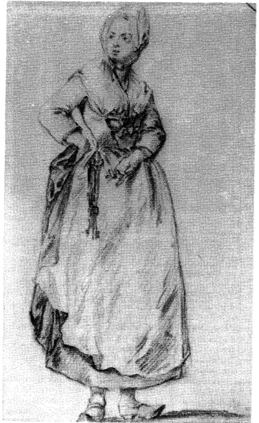
Abb. 7 Zeichnung von Jeurat