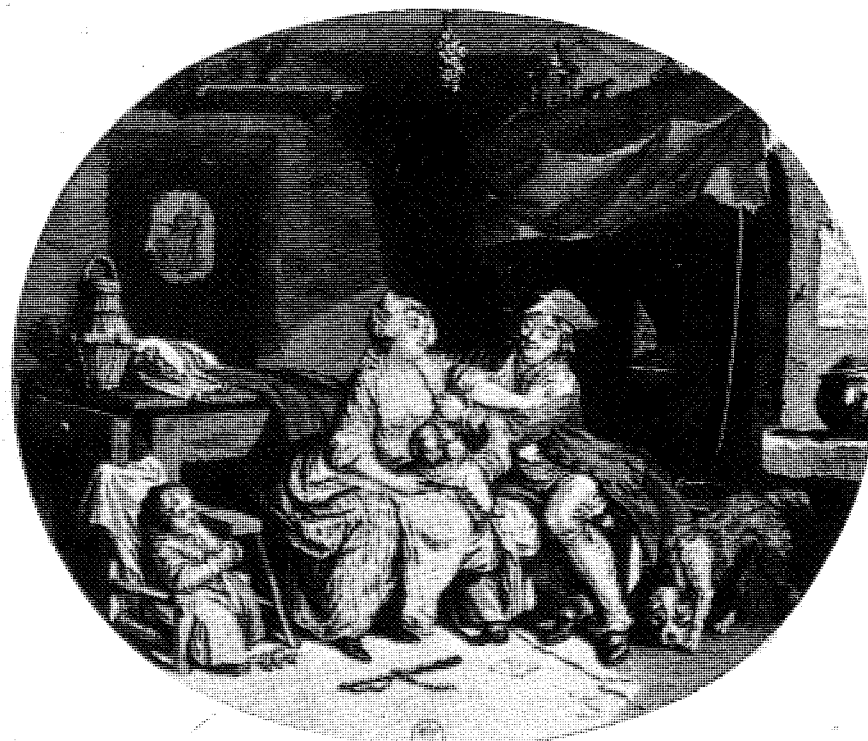
Abb. 3 und 4 Ehefreuden und Familienglück (Stiche von N. de Launay)

Was man in den Bittschriften über die Beziehungen zu den Kindern lesen kann, dürfte diese Beobachtung bestätigen. Erwartungen, bei denen man den Verdacht haben kann, daß sie von Stereotypen geprägt sind, werden auf den Kopf gestellt, und es zeigt sich deutlich, daß die Bezeichnung »schlechte Mutter« in der Argumentation der Männer gegen ihre Frauen keine besondere Rolle spielt. Dagegen bemerkt man erstaunt, daß die Frauen sich ziemlich nachdrücklich darüber beklagen, wie wenig sich ihre Männer um die Kinder kümmern. Sie lassen nicht zu, daß sie sie mißhandeln, das versteht sich von selbst; aber sie dulden ebensowenig, daß er sie im Stich läßt, oder auch nur, wie eine von ihnen sagt, »daß er sich wenig um sie schert«, sie nicht versorgt oder »unanständige Reden« vor ihnen führt. Es gehört zu den wirtschaftlichen und bürgerlichen Pflichten des Mannes, für den Unterhalt seiner Kinder aufzukommen; die Mutter ist darauf angewiesen, daß er diese Verantwortung übernimmt, und sie macht es bekannt, wenn er es vergißt – wobei sie gleich-